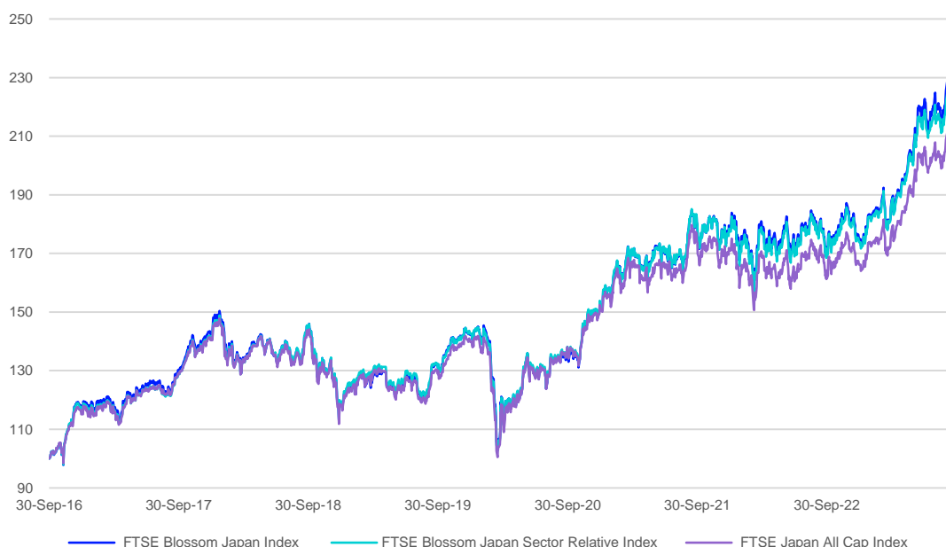
図表 2. FTSE Blossom Index シリーズは引き続き 伝統的の時価総額指数をアウトパフォーマンス